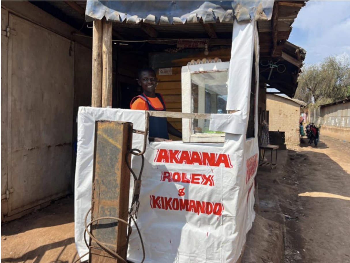
Figuur 3 Rolex kraam (Rolled Egg s) met Twaha, een van de straatjongens

In de komende periode is onze visie om naast de Street Kids Days, waarin essentiële basisbehoeften worden vervuld, meer nadruk te leggen op het bieden van een toekomst aan de straatkinderen bijvoorbeeld door middel van opleiding of werk-leer plekken te realiseren. De Street Kids Days zijn al jaren erg succesvol en Akaana zal deze dagen blijven organiseren. De Street Kids Days dienen ook als basis voor het aangaan van contact met de kinderen om vervolgens hulp, opleidingen en verdere levensbehoeften te verschaffen.