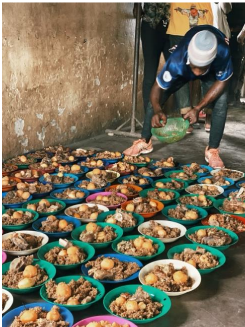
Figuur 1 Voedzame maaltijd van rijst, bonen, groente en aardappel

Akaana is van oorsprong een project dat straatkinderen ondersteunt in hun basisbehoeften, zoals eten, drinken, persoonlijke hygiëne, kleding, en medische hulp. Al zeven jaar organiseert Akaana twee keer per week een Street Kids Day. Tijdens deze dagen komen zo'n 80 straatkinderen en kinderen uit sloppenwijken samen om een voedzame warme maaltijd en schoon drinkwater te ontvangen. Daarnaast krijgen ze de mogelijkheid om zichzelf en hun kleren te wassen, nagels te knippen of zich te scheren. Zo nodig kan kleine medische hulp worden verleend zoals wondverzorging bij een lokale dokter of bij tandproblemen naar een tandarts. Naast het voorzien in deze essentiële levensbehoeften, doen de straatkinderen sociale contacten op en brengt ons lokale team ze basismanieren bij, en voorlichting over criminaliteit en drugs. Maar bovenal krijgt ieder straatkind de kans om tijdens de Street Kids Day te ontspannen met muziek, spel en dans. Het is een mogelijkheid om een middag even te ontsnappen aan het harde leven op straat.